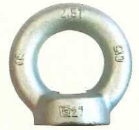
542 (DIN 582)